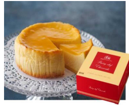
帝国ホテルチーズケーキ