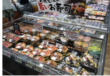
魚売場の素材を使ったお寿司