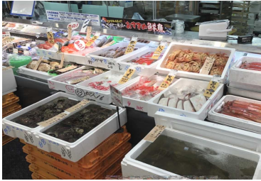
市場をイメージした魚売場