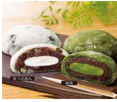
東京クリーム大福