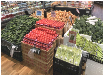
買い回りしやすい野菜売場