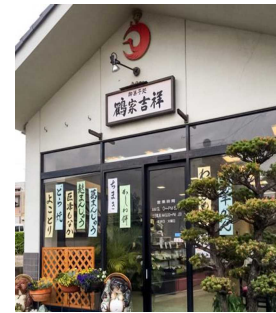
地元人気店「Patisserie FUKAYA」の商品をコーナー化