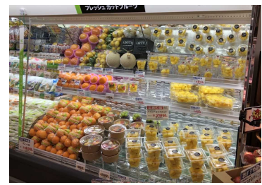
フレッシュなカットフルーツ