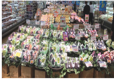
種類豊富な果物売場