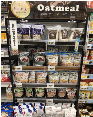
毎日の健康 オートミール