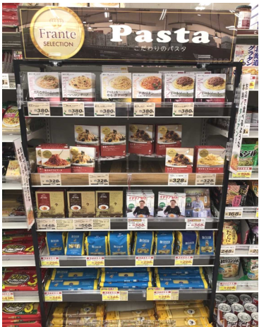
フランテこだわりのパスタ売場