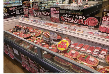
牛肉希少部位の販売増加