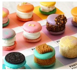
韓国スイーツで話題の太っちょなマカロン「トゥカロン」