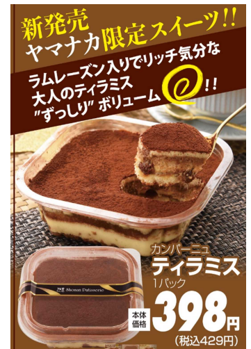
ヤマナカ限定 ティラミス