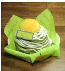
風味豊かな抹茶ムースモンブラン