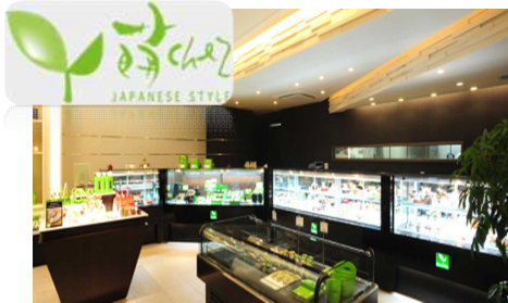
安田店の地元洋菓子店「萌 chez」