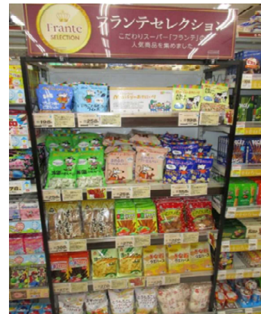
素材にこだわったお子様用の菓子売場